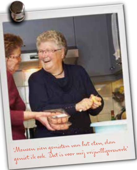
Mensen zien genieten van het eten, dan geniet ik ook. Dat is voor mij vrijwilligerswerk!