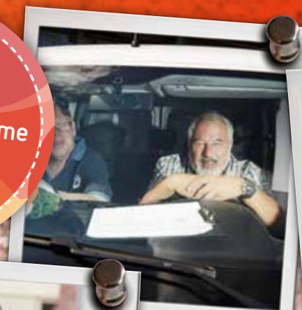
'Anderen mensen. Vrijwilligerswerk'