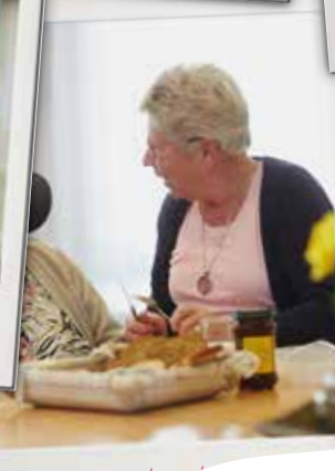
'Iets positiefs doen voor de wereld. Dat is voor mij vrijwilligerswerk'