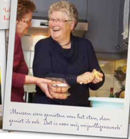
'Mensen zien genieten van het eten, dan geniet ik ook. Dat is voor mij vrijwilligerswerk'